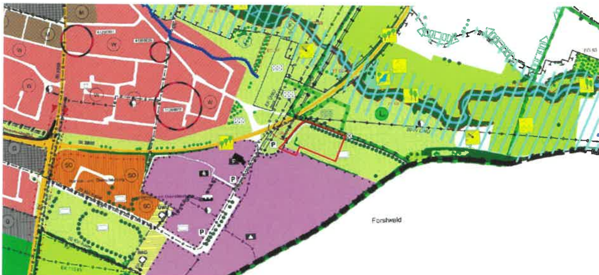
Abb. 3: Auszug aus dem rechtskräftigen Flächennutzungsplan mit Kennzeichnung des Geltungsbereichs (ohne Maßstab)

Eine Änderung des Flächennutzungsplans im Parallelverfahren gem. § 8 Abs. 3 BauGB ist daher notwendig.