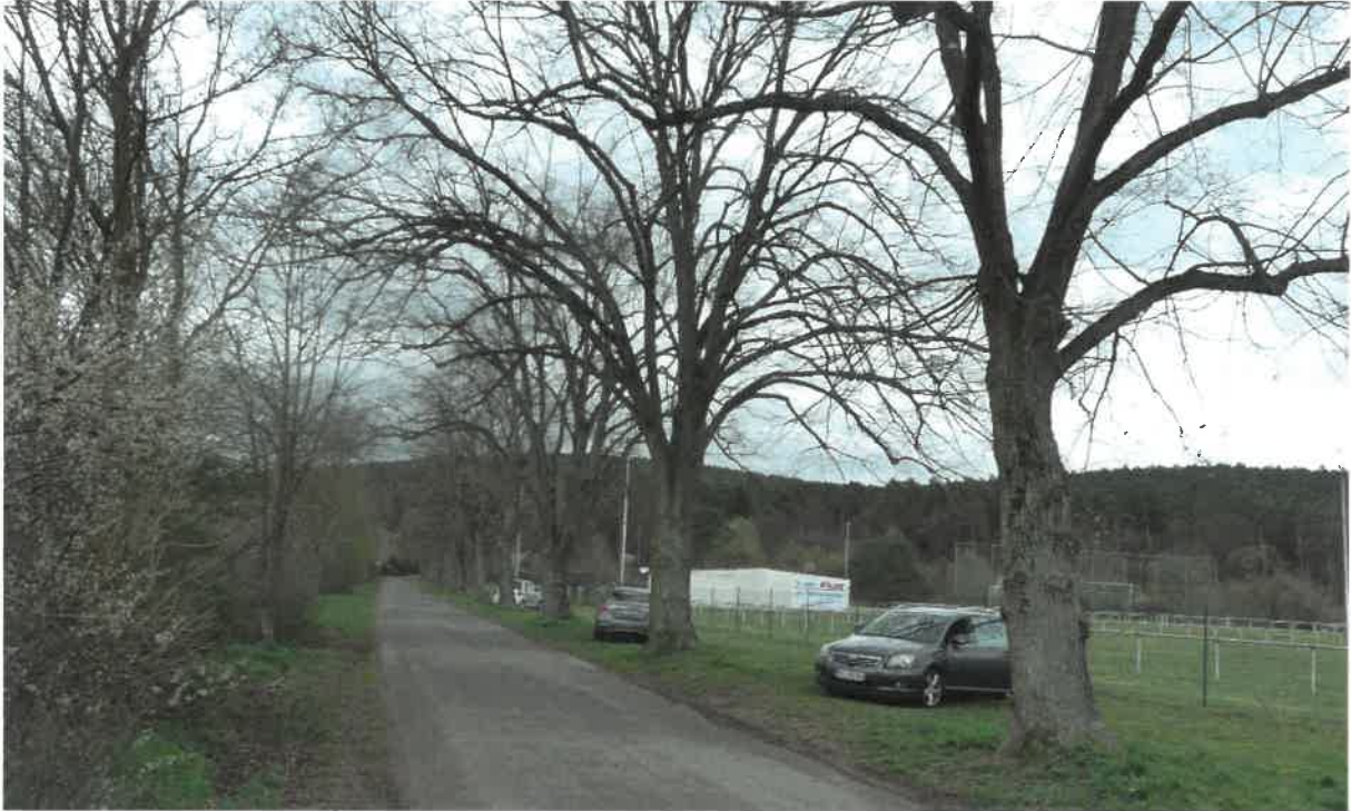
Abb. 5: Alleebäume

Die Sportanlage wird im Norden durch einen Forst- und Wirtschaftsweg begrenzt. Entlang dieses Weges befindet sich eine alte Baumallee mit hoher Wertigkeit. Zum Schutz und dauerhaften Erhalt dieser Allee wurde sie in den Geltungsbereich eingeschlossen und als öffentliche Grünfläche mit Erhaltungsgebot für die vorhandenen Bäume ausgewiesen.