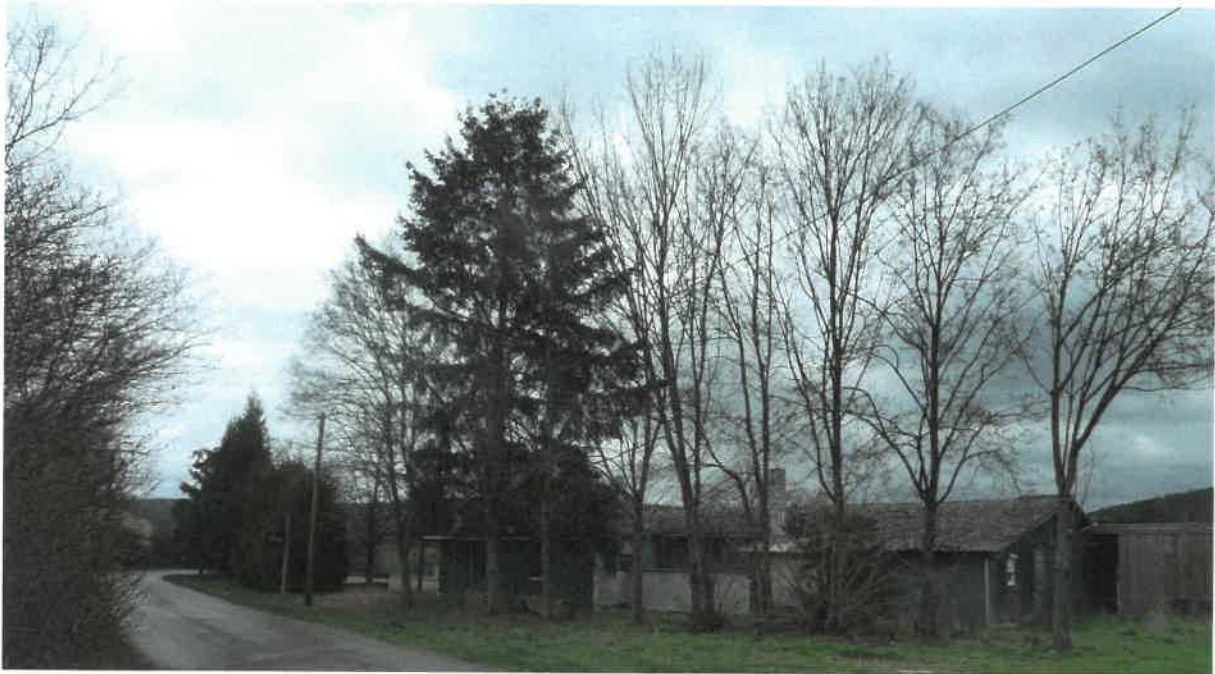
Abb. 6: Weitere Gehölze im Nordwesten und ehemaliges, bereits abgebrochenes Vereinsheim

Im Bereich der Obdachlosenunterkünfte befinden sich vier, im Jahre 2022 errichtete Wohncontainer zur vorübergehenden Unterbringung von Obdachlosen sowie zwei weitere Kfz-Stellplätze.