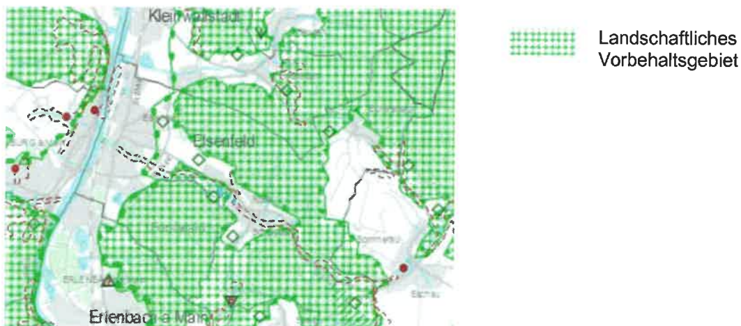
Abb. 2: Ausschnitt des Regionalplans Bayerischer Untermain (1), Karte 3 „Landschaft und Erholung“ Lesefassung für das Internet 24.9.2010

Das Plangebiet selbst ist im rechtsverbindlichen Regionalplan nicht als „Landschaftliches Vorbehaltsgebiet“ ausgewiesen. Mit einer Bebauung wird eine Abrundung des Ortsrandes an dieser Stelle geschaffen.