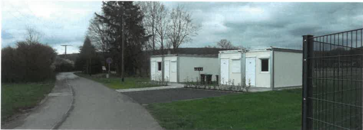
Abb. 7: Wohncontainer mit zwei Stellplätzen

Im Bereich der Obdachlosenunterkünfte befinden sich vier, im Jahre 2022 errichtete Wohncontainer zur vorübergehenden Unterbringung von Obdachlosen sowie zwei weitere Kfz-Stellplätze.