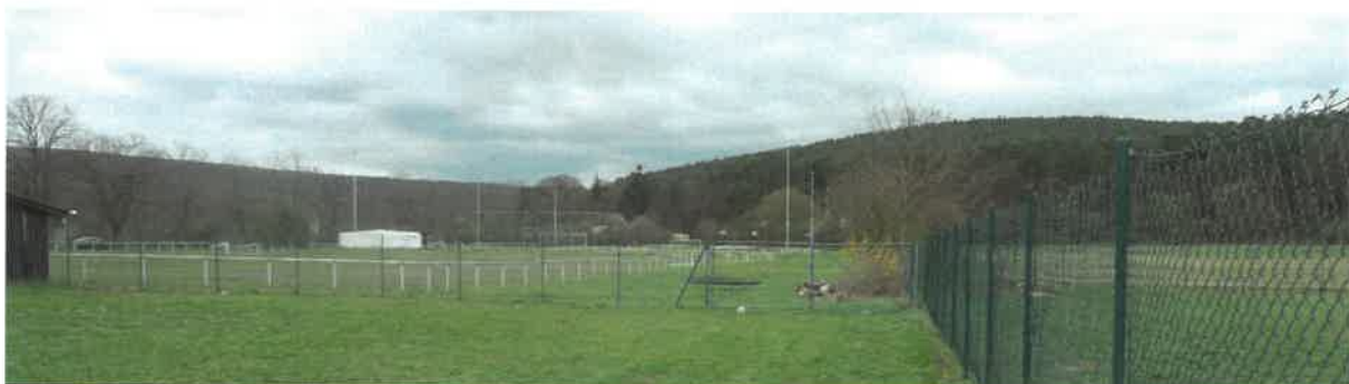
Abb. 4: Sportanlage

Die gesamte Sportanlage wie auch der Bereich der Obdachlosenunterkünfte ist größtenteils von einem grünummantelten Maschendrahtzaun umgeben. Um das ehemalige Sportfeld befand sich eine übliche Spielfeldbarriere, welche zwischenzeitlich durch den Markt Elsenfeld entfernt wurde.